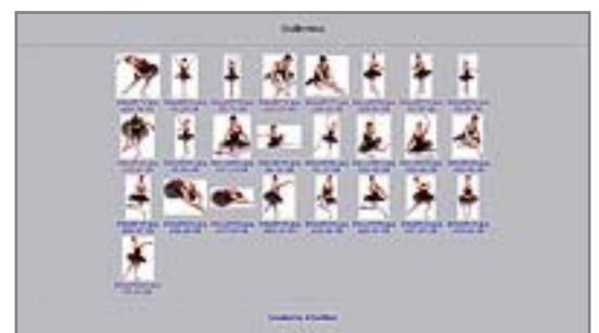
Abb. 4: Fertige HTML-Bildgalerie