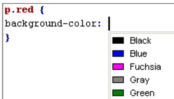
Abb. 3: Manuelle Eingabe über eine Drop-Down-Liste für die Wertzuweisung.